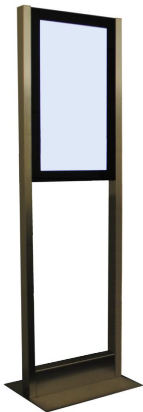
Optional mit Edelstahl Fussplatte

Der H-Type ist ein professionelles Informations- und Anzeigesystem für die verschiedensten Anwendungen.